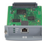
J7960G Serveur d'impression interne HP Jetdirect 625n (EIO, 10/100/1000TX)